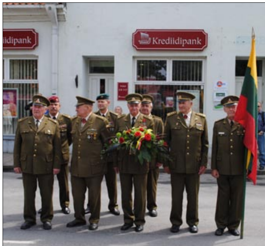
Leedu partisanid Kuressaares