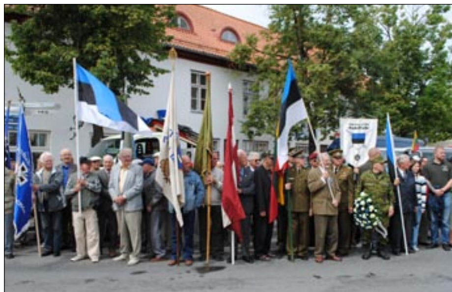
Eesti, Läti ja Leedu vabadusvõitlejad Kuressaare kesklinnas, 14. juulil 2012.