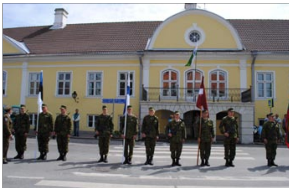
Eesti, Soome ja Läti riigilipud Kuressaare kesklinnas, 14. juulil 2012.