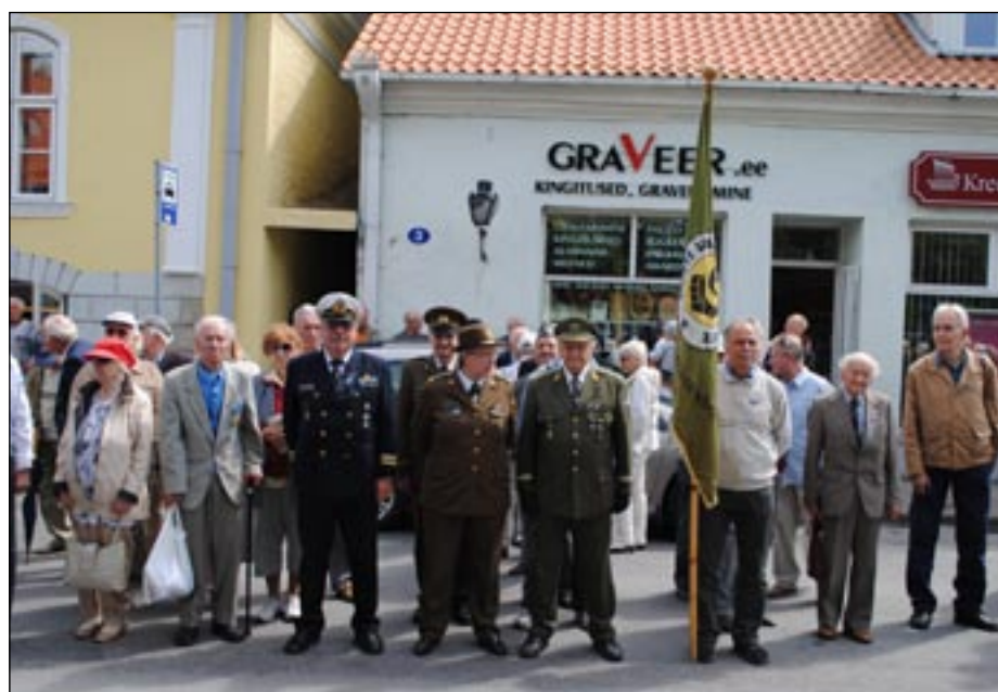
Eesti Vabadusvõitlejad Kuressaares.